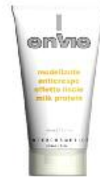
modellante anticrespo effetto liscio [150 ml] EN404

Mousse cream με πρωτεΐνες γάλακτος είναι περιποιητικό και ιδανικό για κατσαρά και ξηρά μαλλιά. Κάνει τα μαλλιά γυαλιστερά και μαλακά με ελαφρύ κράτημα.