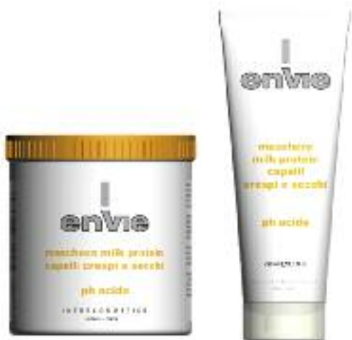
maschera milk protein [250/1000 ml] EN402 / EN403

MASCHERA MILK PROTEIN PH ACIDO PER CAPELLI CRESPI E SECCHI È UN CONDIZIONANTE RICCO DI PROTEINE DEL LATTE CHE LASCIA I CAPELLI MORBIDI E LUCIDI E FACILITA LA PETTINABILITÀ.