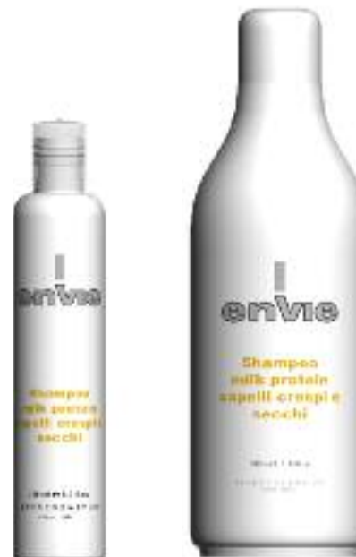
shampoo milk protein [250/1000 ml] EN400 / EN401

Μασκα milk protein με οξινό pH για κατσαρά και ξηρά μαλλιά είναι μια περιποίηση πλουσία σε πρωτεΐνες γαλακτος που κανουν τα μαλλια μαλακα, γυαλιστερα και ευκολοχτενιστα.