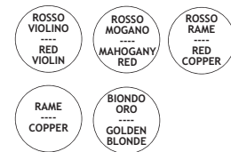
color meches [200 gr.]

POLVERE DECOLORANTE E COLORANTE MONOFASE COMPATTA NON AGGRESSIVA A BASSO CONTENUTO AMMONIACAILE. DECOLORA E COLORA IN SOLI 15/20 MINUTI. ADATTA SIA SU CAPELLI NATURALI CHE COLORATI.