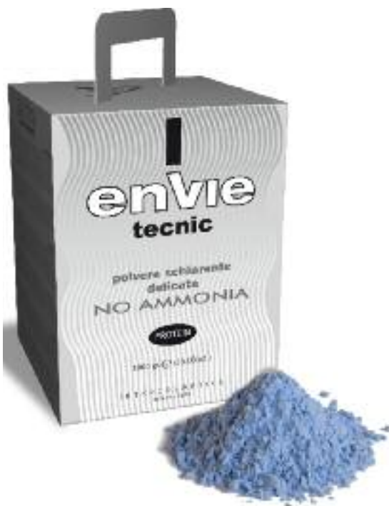
polvere schiarente delicata no ammoniaca [1000 gr] EN321

ENVIE DEKÒ È UNA POLVERE DECOLORANTE NON VOLATILE SENZA AMMONIACA AD AZIONE DELICATA E PROGRESSIVA DI OTTIMA PROFUMAZIONE. L'AZIONE SCHIARENTE DELICATA AVVIENE SENZA AGGREDIRE LA FIBRA CAPILLARE GRAZIE ALLE PROTEINE DEL GRANO, NUTRIENTI CHE AIUTANO I CAPELLI A RESTARE LUCIDI E SETOSI. IL POTERE SCHIARENTE SI ARRESTA DOPO 6 TONI DI SCHIARITURA. LA MISCELAZIONE PUÒ ESSERE EFFETTUATA CON CREMA OSSIDANTE DA 20 - 30 - 40 VOLUMI ( 50 GR. DI POLVERE DECOLORANTE + 100 ML. DI CREMA OSSIDANTE ). LA POLVERE DI COLORE BLU UNA VOLTA MISCELATA DIVENTA GELATINOSA FACILITANDO L'APPLICAZIONE E GARANTENDO UNA PERFETTA ADESIONE AL CAPELLO, OLTRE A PERMETTERE DI CONTROLLARE FACILMENTE IL GRADO DI SCHIARITURA OTTENUTO. ADATTO PER TUTTE LE MODERNE TECNICHE DI MECHES E DECOLORAZIONI TOTALI. I TEMPI DI POSA VARIANO DA 15 A 45 MINUTI, UTILIZZO SENZA FONTE DI CALORE POSA MAX. 45 MIN., UTILIZZO CON FONTE DI CALORE SECCA POSA 30 MIN.