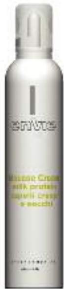
mousse cream [300ml] EN406

MOUSSE CREAM ALLE PROTEINE DEL LATTE AD EFFETTO CONDIZIONANTE È IDEALE SU CAPELLI CRESPIE SECCHI. RENDE I CAPELLI LUCIDI E MORBIDI, FISSANDO LEGGERMENTE.